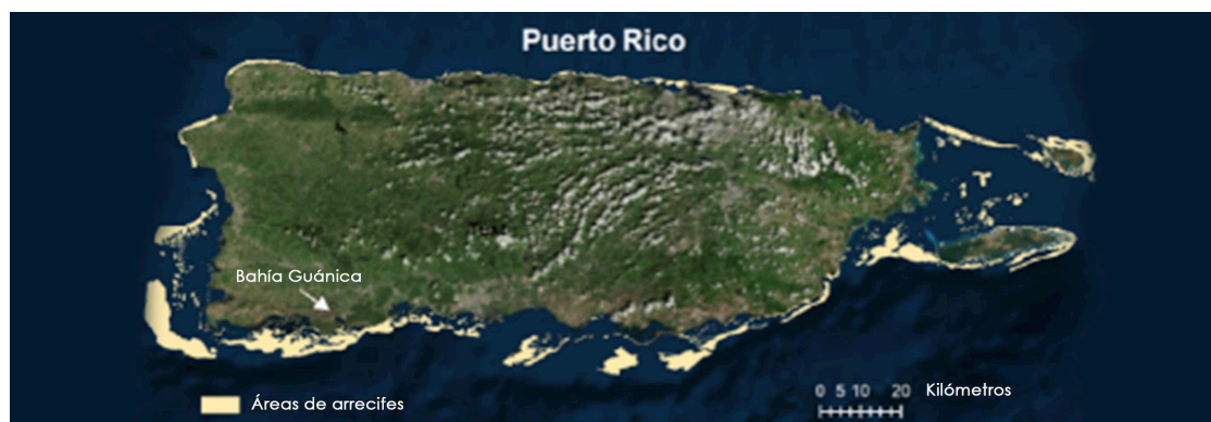
Mapa de Puerto Rico

Al considerar solo a los visitantes que utilizaron los arrecifes, se realizaron 843,651 viajes personados durante el verano y 327,717 viajes personados durante el invierno. Los usuarios de arrecifes coralinos gastaron más de 7.1 millones de días personados recreándose durante el verano y cerca de 2.9 millones de días personados durante el invierno. Un día personado se refiere a la cantidad de días que una persona invierte durante su viaje. Por lo tanto, en un viaje donde la persona esté cinco días, cuenta como cinco días personados. Si hay 3 personas en ese viaje, entonces serían 15 días personados. En un día promedio durante el verano, había un promedio de 4,600 visitantes utilizando el arrecife, mientras que en invierno, 1,800 visitantes utilizaron los arrecifes.